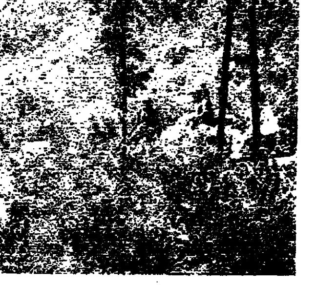
جنود العدو قرب عينا الشعب

خسائر عديدة في الأرواح ، وعلى الأثر هربت قواتنا إلى مكان الاستحكام لتعزز المركز مما جعل العدو على دفع قوات جديدة التحجبت في قتال حار مع قواتنا . بعد العدو إلى استخدام منهجية وطرائقه لتصف قواتنا ومرايضنا التي تصدى باستمرار لتحشداته الحدودية الجديدة وقوات تنقله موقعة فيها الخسائر الجديدة . ما تزال قواتنا على أرض المعركة للدائرة في منطقة عيننا الشعب مشجعة مع القوات الغازية وتعرض لتصف مدفعي وجوي . وقال البلاغ التالي : الحقا